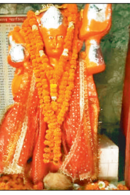
हरिभूमि न्यूज ▶▶ रायगढ़

तथा महतारी वंदना में काम किए हुये आंगनबाड़ी कार्यकर्ता एवं महिला समूहों की राशि स्वीकृत हुआ है और वह राशि एक साथ कार्यालय के जरिए वितरित हो रही है। गरम भोजन की राशि के भुगतान के महिला समूहों से तथा तथा शेष राशि आंगनबाड़ी कार्यकर्ता से अलग अलग कमीशन लेने का तथ्य सामने आया है जिसमें प्रत्येक आंगनबाड़ी कार्यकर्ता को 1-1 हजार देनी पड़ रही है। इस राशि को पुसौर जनपद के 331 कार्यकर्ताओं द्वारा दिए जाने का खबर प्रकाश में आया है जिसकी पुष्टि स्वयं आंगनबाड़ी कार्यकर्ता भी तैयार नहीं है चूंकि अपने नौकरी गंवाने का