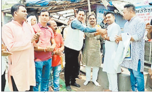
प्याऊ का शुभारंभ करते हुए।